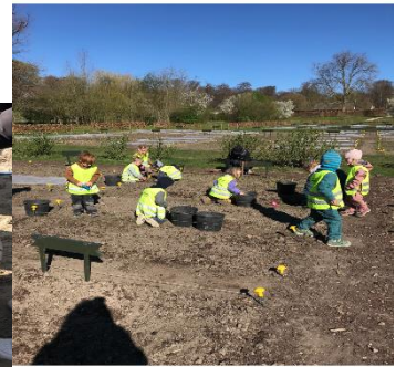
haver til maver

Vi har i efteråret brugt vores personaledag på at snakke kommunikation. Hvordan vi kommunikerer til hinanden, til børn, om hinanden, om børn og hvordan vi korrigerer børn (skælder ud). Vi arbejder med principperne i Marte Meo, når man gør det, bør der være en særlig måde vi kommunikerer på. Det skal vi fastholde.