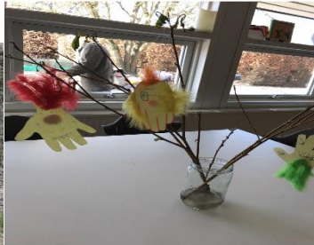
venlige hænder i påske projekt